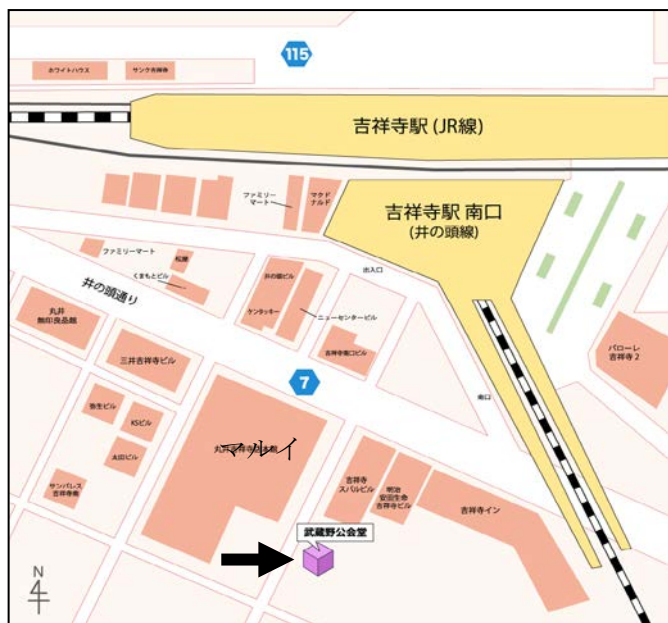
武蔵野公会堂(ホール) 武蔵野市吉祥寺南町 1-6-22