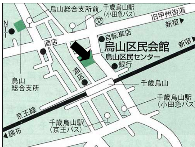
烏山区民会館（集会室） 世田谷区南烏山 6-2-19